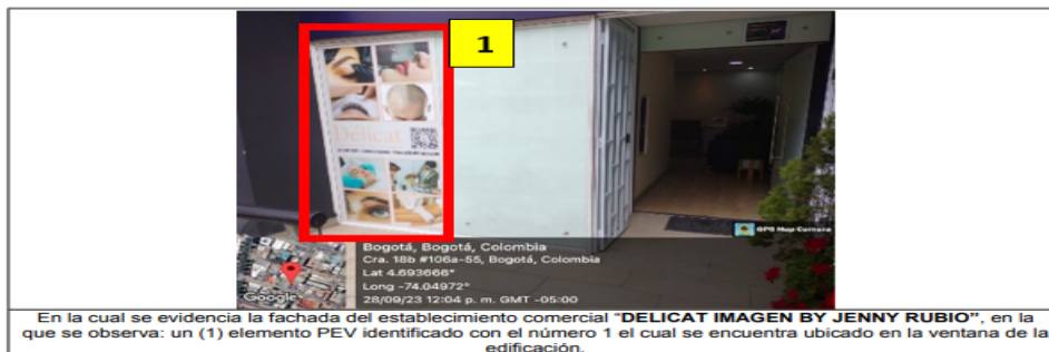
En la cual se evidencia la fachada del establecimiento comercial "DELICAT IMAGEN BY JENNY RUBIO", en la que se observa: un (1) elemento PEV identificado con el número 1 el cual se encuentra ubicado en la ventana de la edificación.

Registro fotográfico allegado mediante el radicado de respuesta SDA No 2023ER241279 del 13 de octubre de 2023.